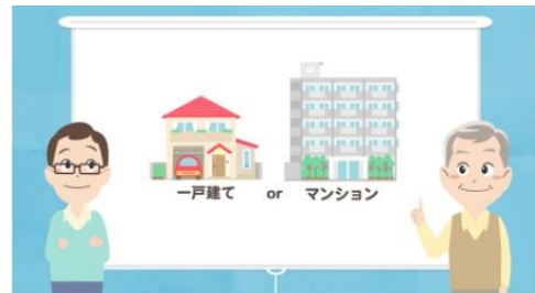
第4話 一戸建てにするか？ マンションにするか？

夫：「それなんだよね！一戸建ての方が土地がある ので資産価値が高いことはわかるんだけど、、、 それとマンションの方が安いとはよく聞くね。」