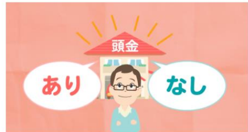
第3話 自己資金ゼロだとどうなる？

夫：「頭金はなくても買えるらしいけど、 あるのとないのとでは、毎月支払う金額や 最終的に支払う金額が変わってくるんだって。」