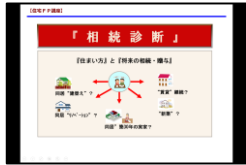
④『相続診断』原稿&ツール