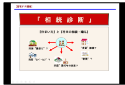
④『相続診断』原稿&ツール